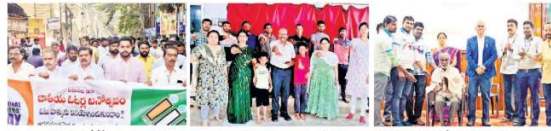
విజయవాడలో ఓటు హక్కుపై అవగాహన కార్యక్రమం

విజయవాడలో ఓటు హక్కుపై ప్రజా సేవ కార్యక్రమంలో పాల్గొంటున్న ప్రజా సేవ కార్యక్రమం